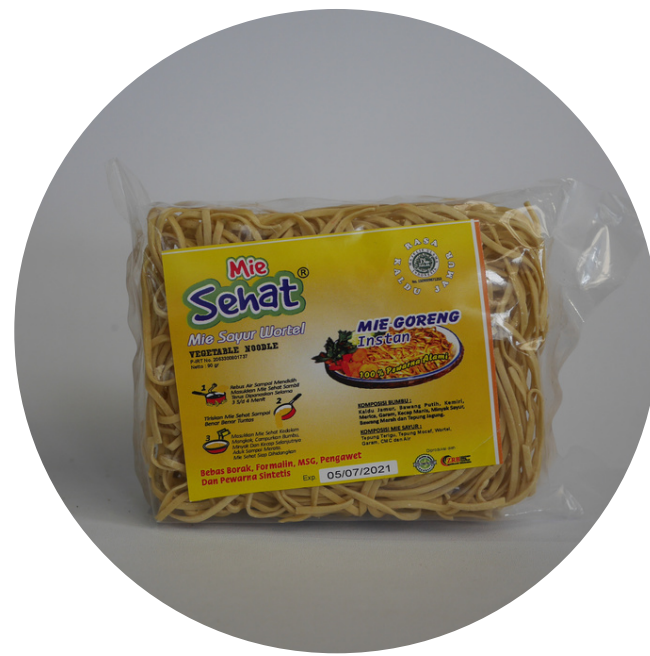
Mie Sehat Besar