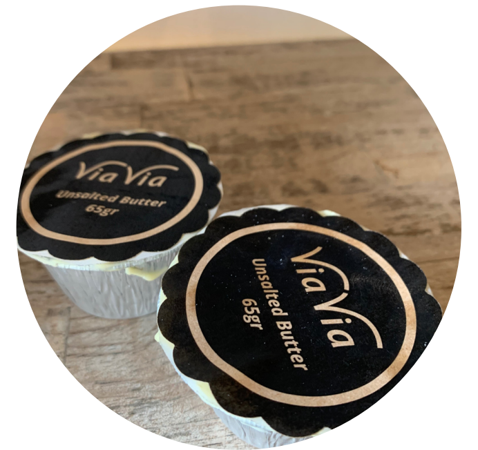
Unsalted Butter 22,000/65gr