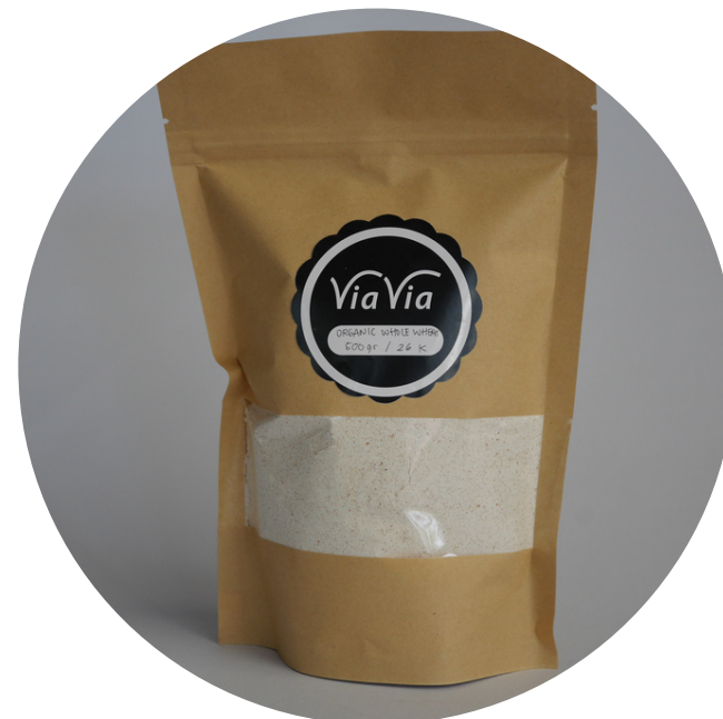
Organic Whole Wheat Flour