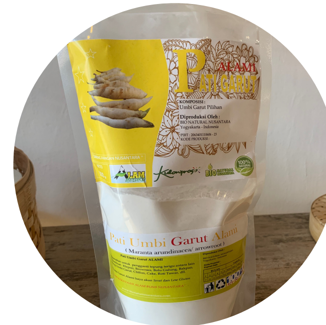
Alami - Tepung Pati Garut