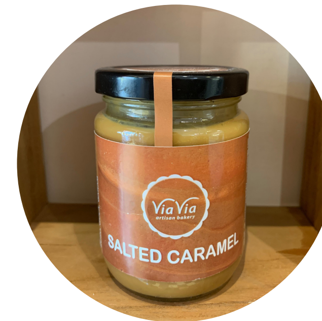
Salted Caramel 45,000/pcs Selai manis asin yang terbuat dari susu dan gula pasir, melalui proses 6 jam.