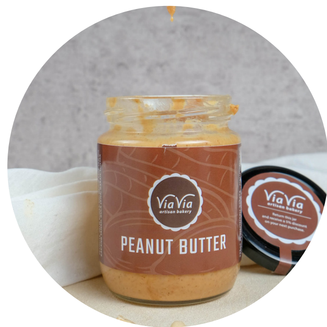
Peanut Butter Jam 42,000/jar Selai kacang dengan gula sedikit