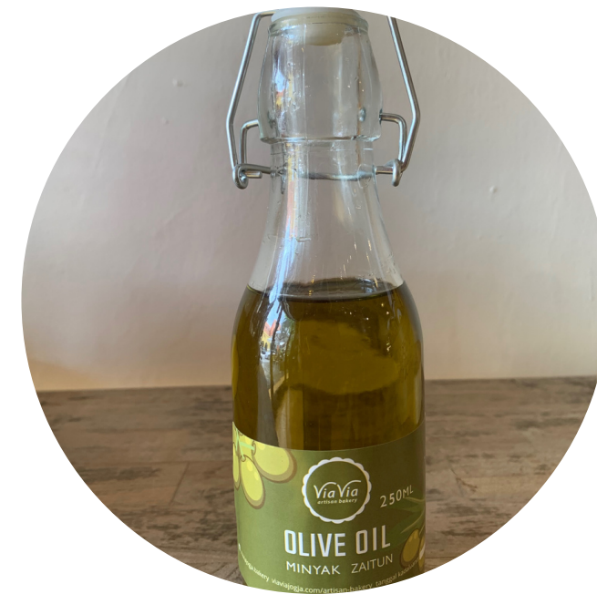
Olive Oil 60,000/250ml