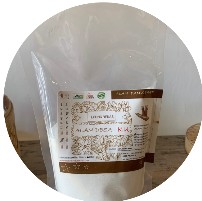
Alami - Tepung Beras