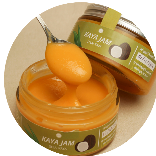
Kaya Jam 32,000/jar olesan yang terbuat dari santan, telur, dan gula