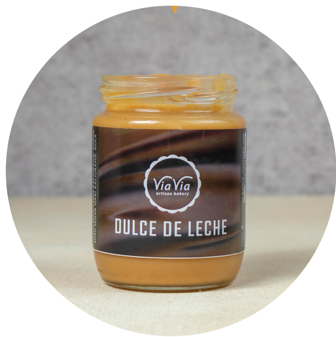
Dulce De Leche 45,000/jar Selai manis yang terbuat dari susu dan gula pasir, melalui proses 6 jam.