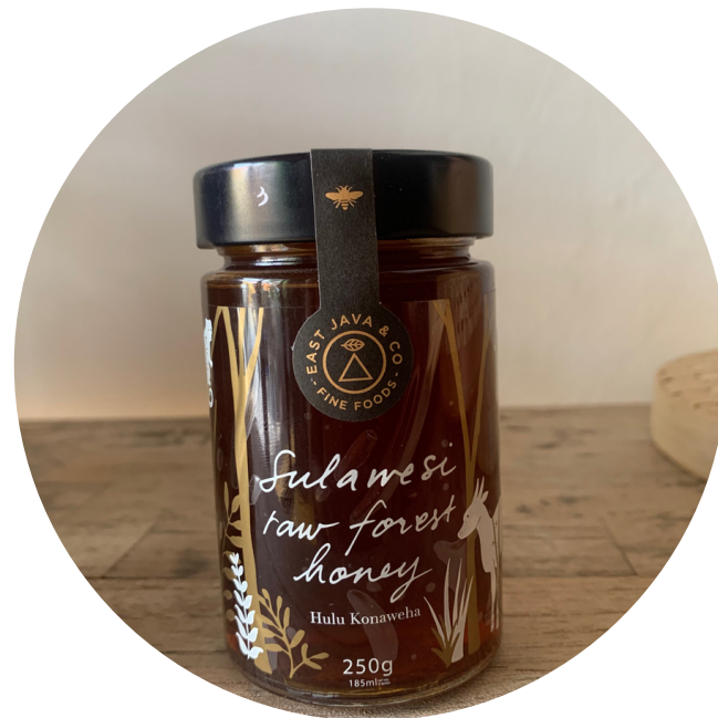
East Co Java - Madu Sulawesi 180,000/botol