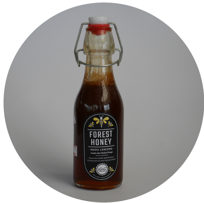
Madu Lanceng 175,000/botol