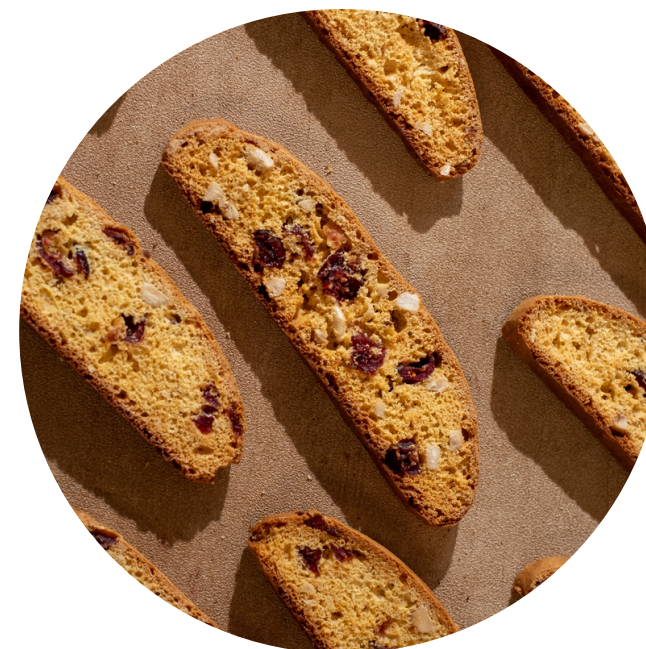
Almond Berry Biscotti 11,000/pcs