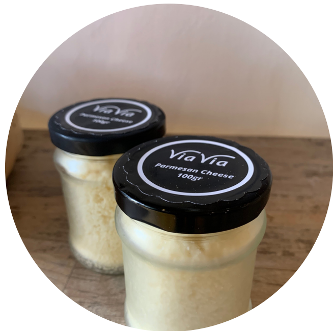
Parmesan Cheese 45,000/100gr