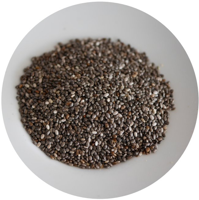
Black Chia Seed (Raw) 25,000/100gr