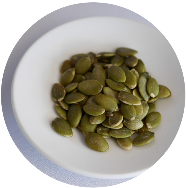
Pumpkin Seed (Raw) 19,000/100gr