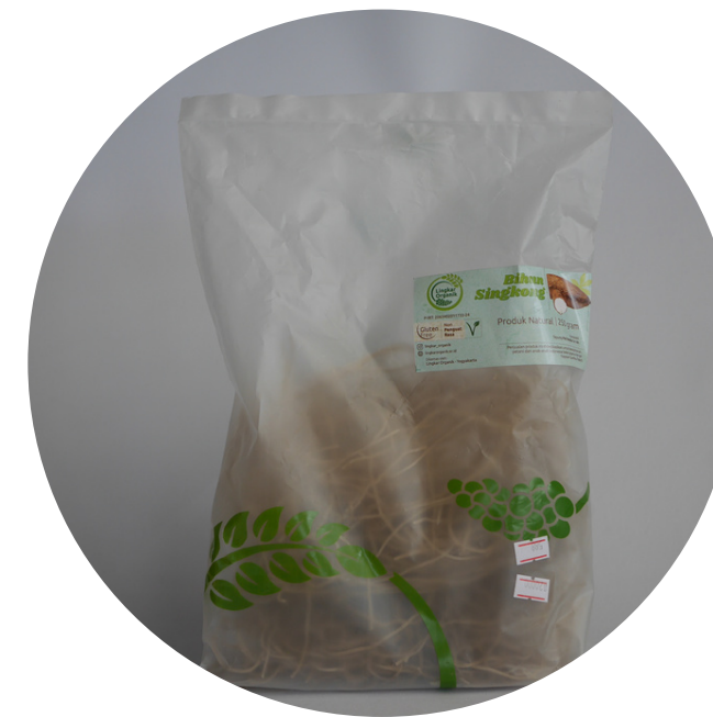
Glutenfree Soun Noodle