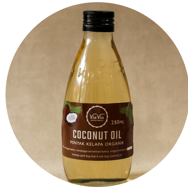
Coconut Oil 25,000/380ml