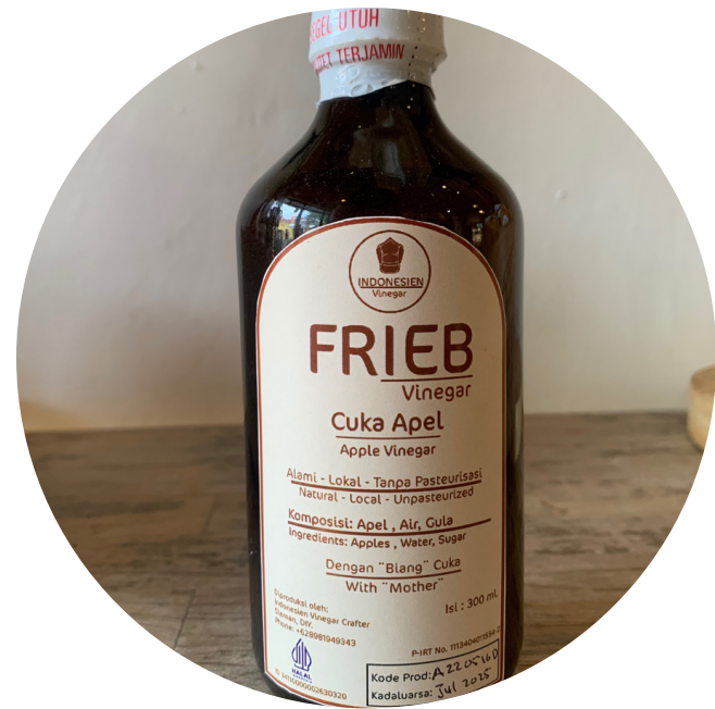
Frieb Apple Vinegar