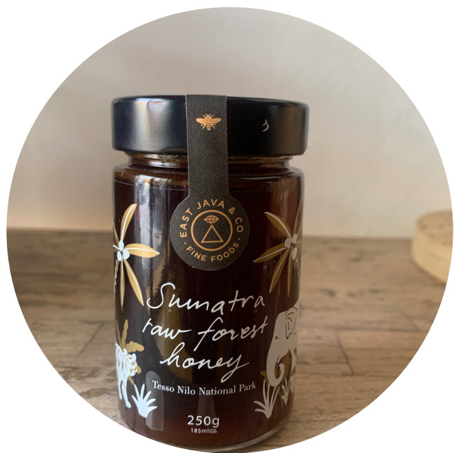
East Co Java - Madu Sumatra 164,000/botol