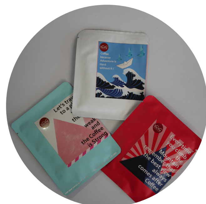
Drip Blue Coffee 13,000/pcs