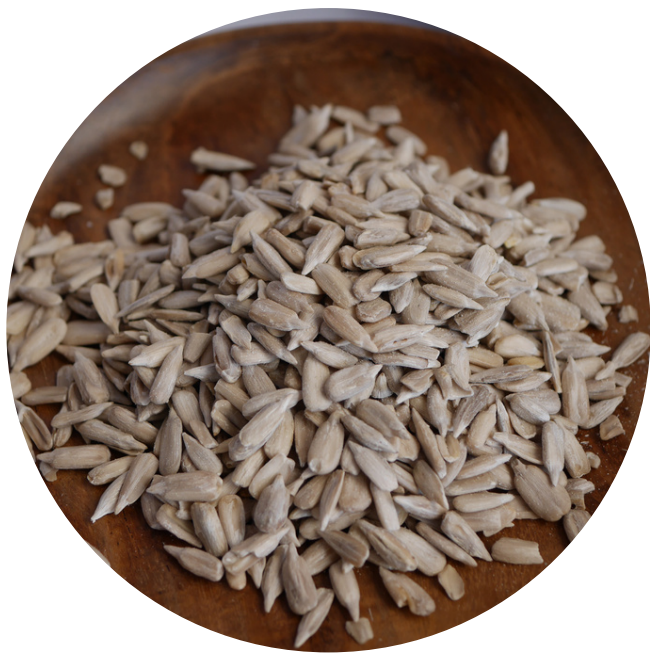
Sunflower Seed (Raw) 14,000/100gr