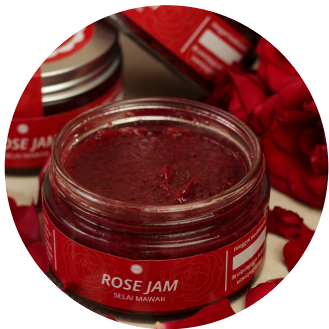
Rose Jam 43,000/jar Selai yang terbuat dari bunga mawar, buah naga, air dan gula.