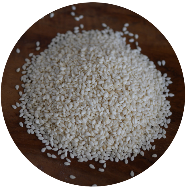
White Sesame Seed (Raw) 13,000/100gr