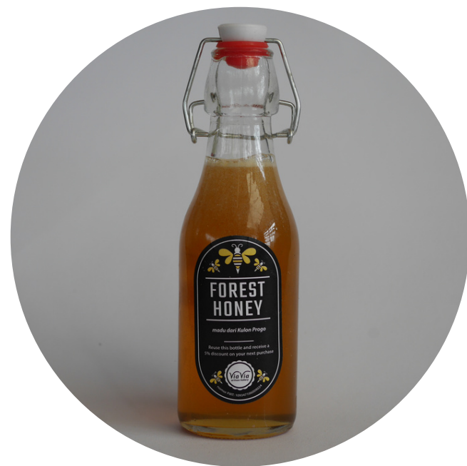
Madu Kulon Progo 125,000/botol