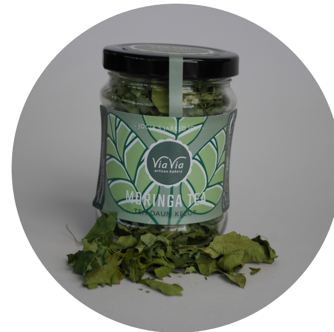
Moringa Tea 15,000