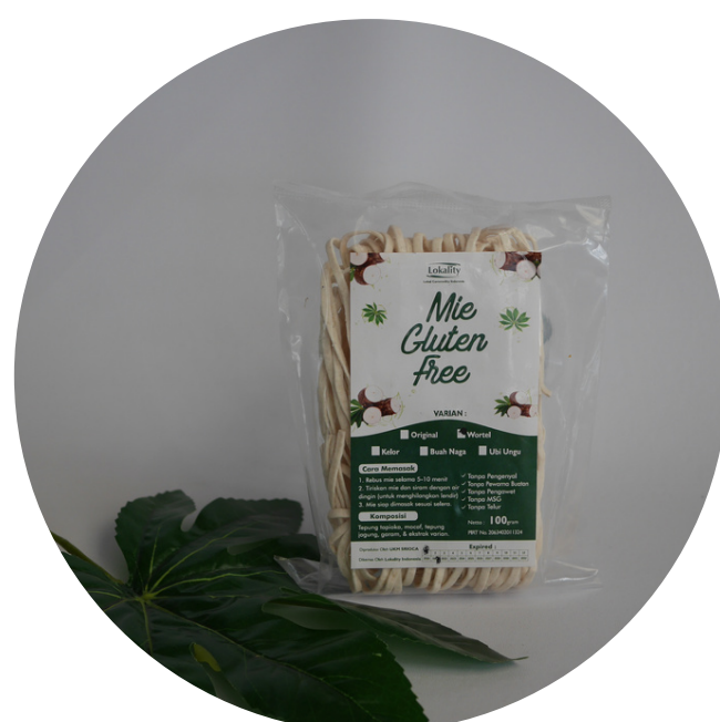
Mie Srioca Glutenfree