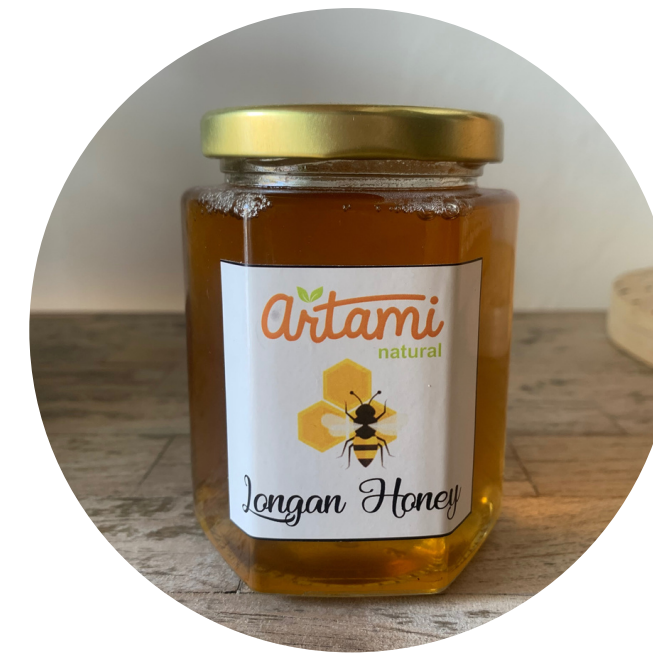
Artami - Longan Honey 74,500/botol