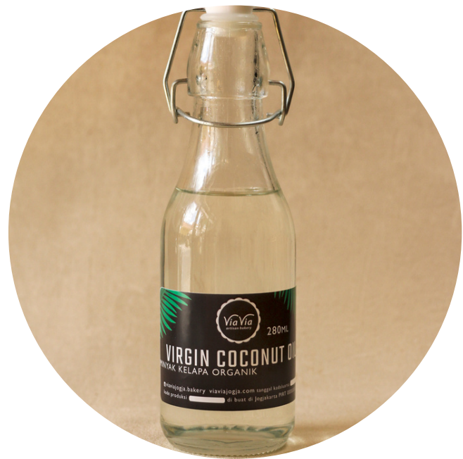
Virgin Coconut Oil 62,000/280ml