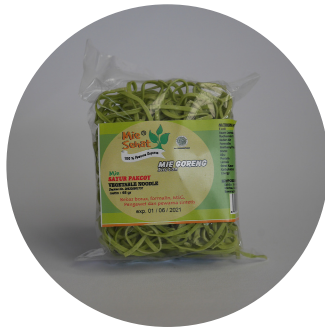
Mie Sehat Kecil