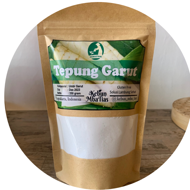
Kebun Tias Tepung Garut