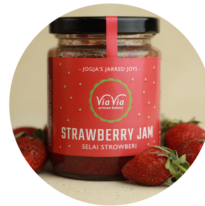
Strawberry Jam 59,000/jar Selai dengan buah asli strawberry dan gula sedikit