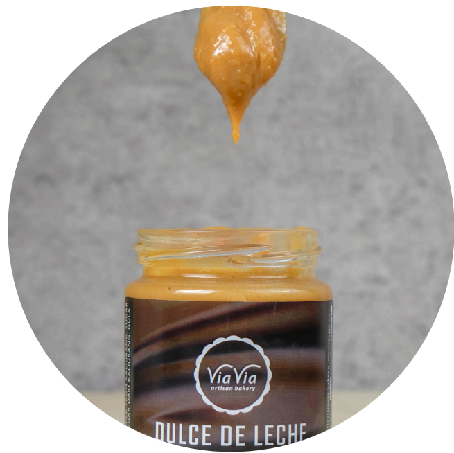
Dulce De Leche 45,000/jar Selai manis yang terbuat dari susu dan gula pasir, melalui proses 6 jam.