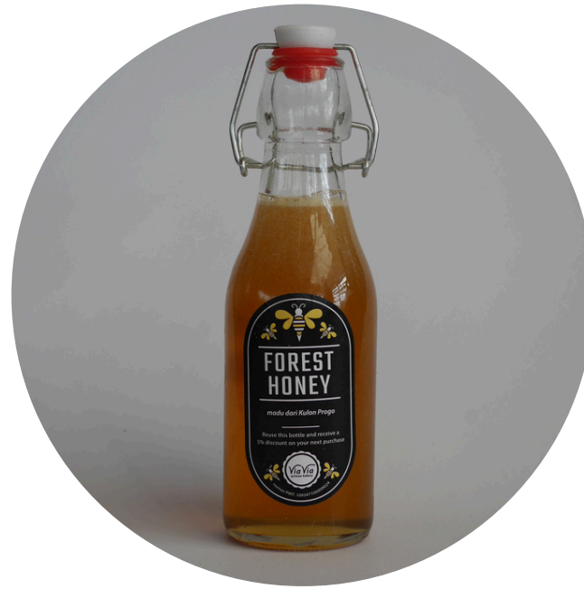
Madu Kulon Progo 125,000/botol