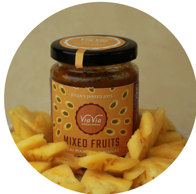
Mix Fruit Jam 45,000/jar Selai yang terbuat dari campuran buah nanas dan markisa dengan sedikit gula dan tanpa pengawet