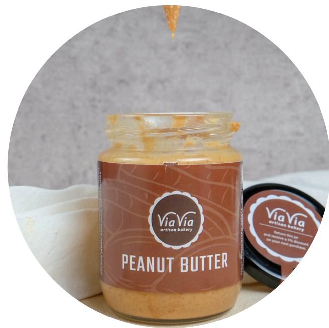
Peanut Butter Jam 42,000/jar Selai kacang dengan gula sedikit