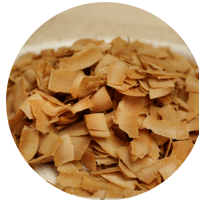
Coconut Chips 14,000/100gr