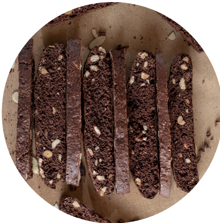
Choconut Biscotti 13,000/pcs