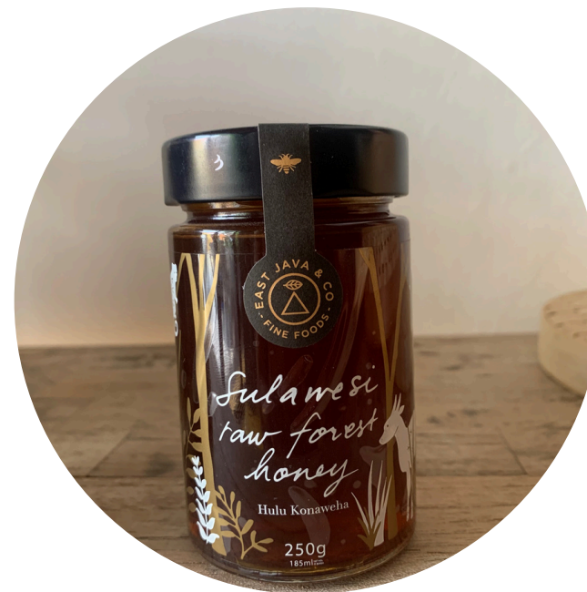
East Co Java - Madu Sulawesi 180,000/botol