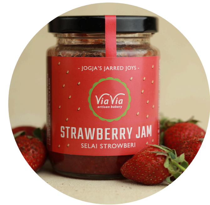
Strawberry Jam 59,000/jar Selai dengan buah asli strawberry dan gula sedikit