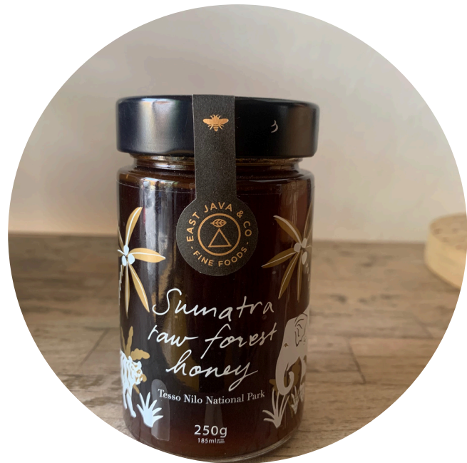
East Co Java - Madu Sumatra 164,000/botol