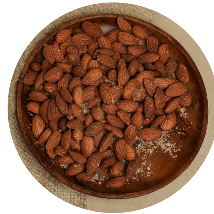
Roasted Almond 37,000/100gr