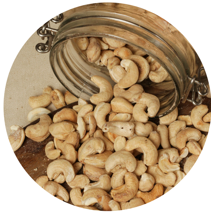
Roasted Cashew 28,000/100gr