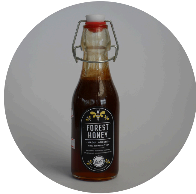
Madu Lanceng 175,000/botol