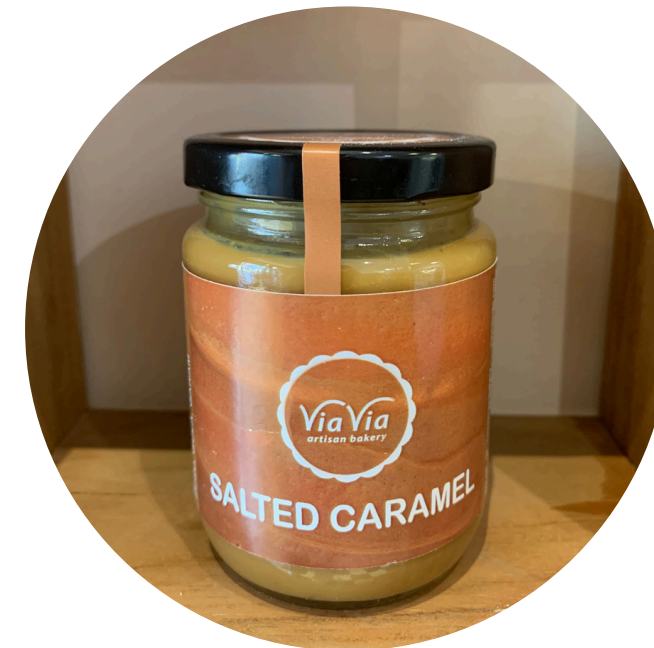
Salted Caramel 45,000/pcs Selai manis asin yang terbuat dari susu dan gula pasir, melalui proses 6 jam.