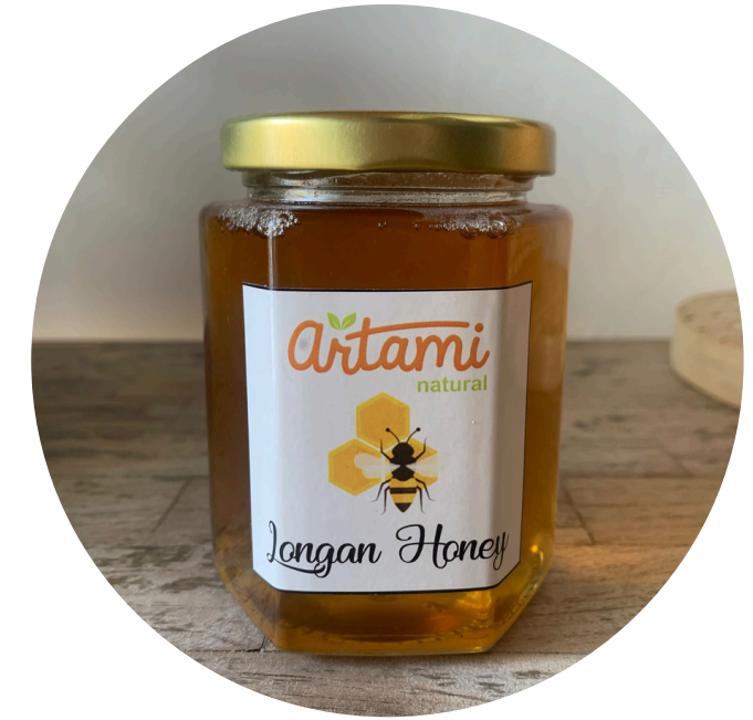
Artami - Longan Honey 74,500/botol