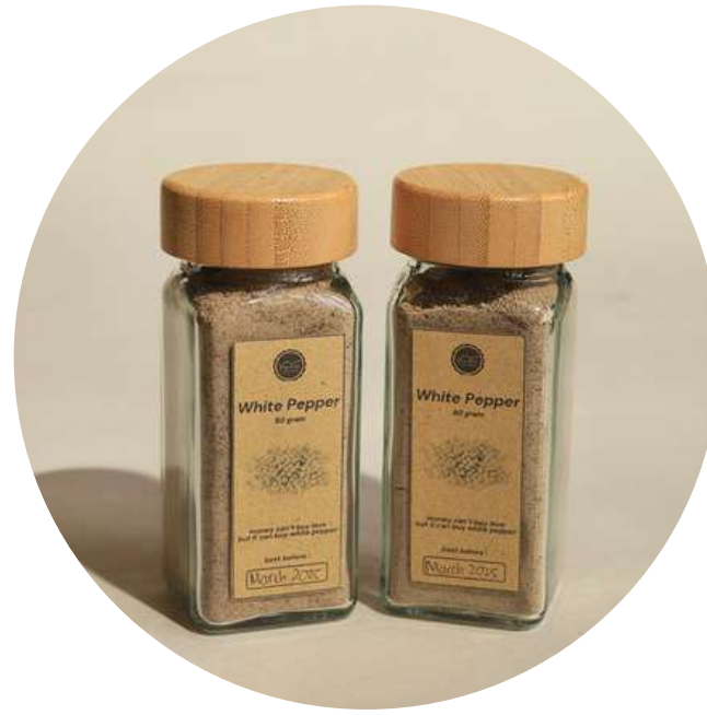
White Pepper 80gr 35.000