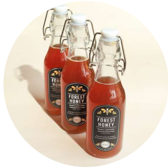
Madu Lanceng 185,000/botol