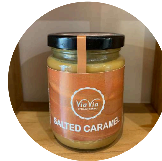
Salted Caramel 47,000/pcs Selai manis asin yang terbuat dari susu dan gula pasir, melalui proses 6 jam.