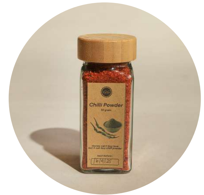
Chilli Powder 50gr 35.000