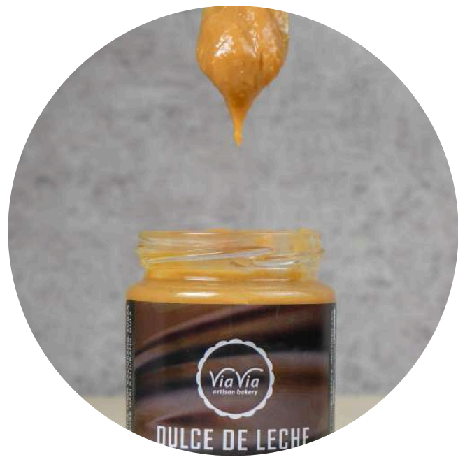
Dulce De Leche 42,000/jar Selai manis yang terbuat dari susu dan gula pasir, melalui proses 6 jam.