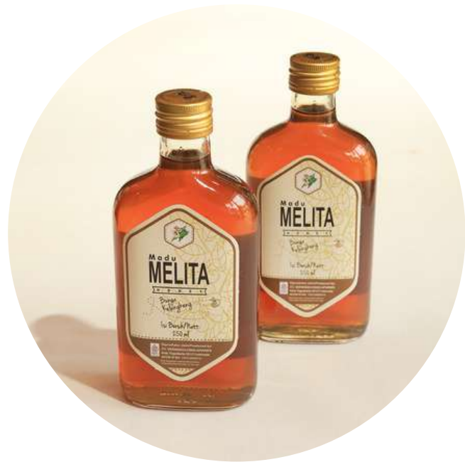
Melita Honey 90,000/botol