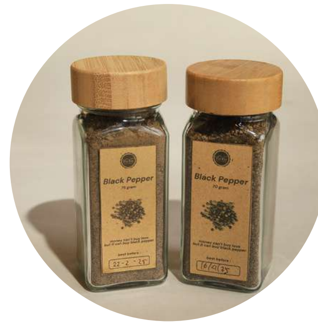
Black Pepper 75gr 37.000