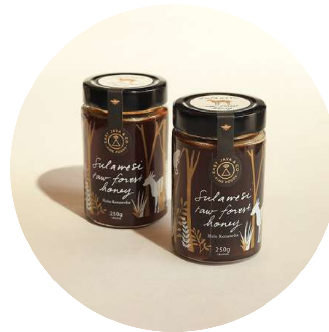
East Co Java - Madu Sulawesi 180,000/botol