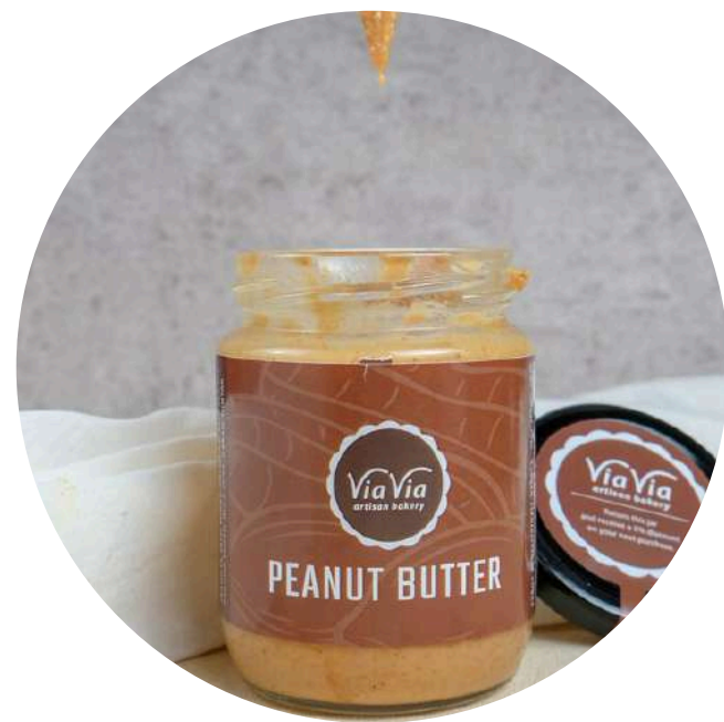
Peanut Butter Jam 45,000/jar Selai kacang dengan gula sedikit