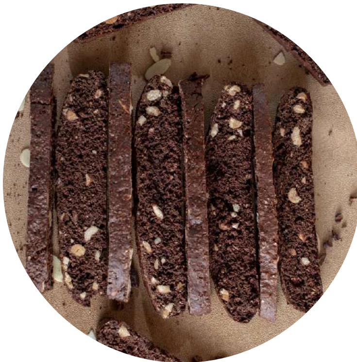
Choconut Biscotti 17,000/pcs