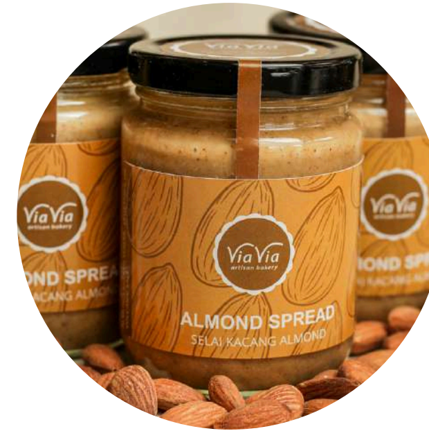
Almond Spread 75,000/jar Terbuat dari kacang almond dan brown sugar.