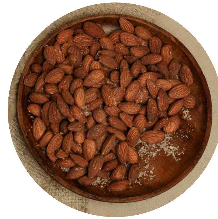
Roasted Almond 37,000/100gr