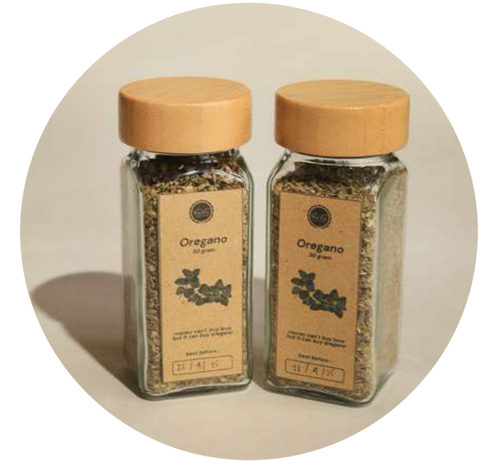
Oregano 30gr 42.000