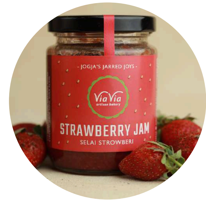
Strawberry Jam 59,000/jar Selai dengan buah asli strawberry dan gula sedikit