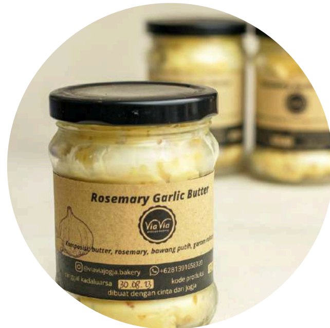
Rosemary Garlic Butter 65.000/jar Olesan roti dari butter, bawang dan rosemary.