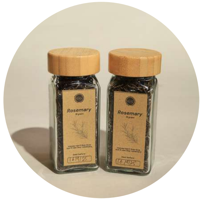
Rosemary 15gr 35.000