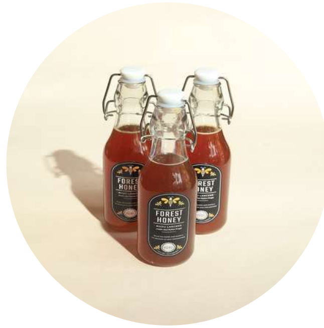
Madu Kulon Progo 135,000/botol