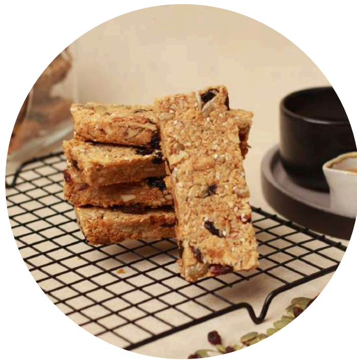
Granola Bar 17,000/pcs Healthy snack bar dengan campuran pat, biji bijian, cransbery dan kismis