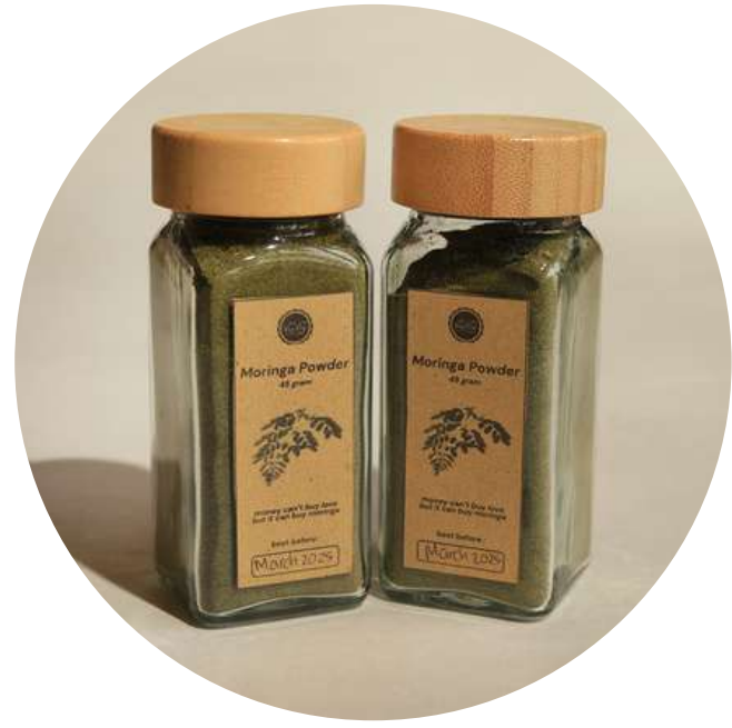
Moringa Powder 45gr 35.000