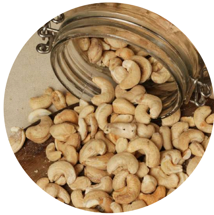
Roasted Cashew 28,000/100gr