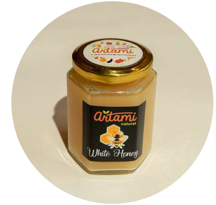
Artami - White Honey 80,500/botol