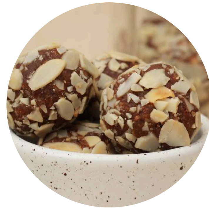
Energy Ball 24,000/2pcs Healthy Snack yang terbuat dari 100% kurma dan kacang almond, tanpa tambahan gula