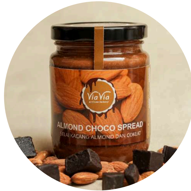
Almond Choco Spread 89.000/jar Selai manis yang terbuat dari kacang almond, coklat dan brown sugar.