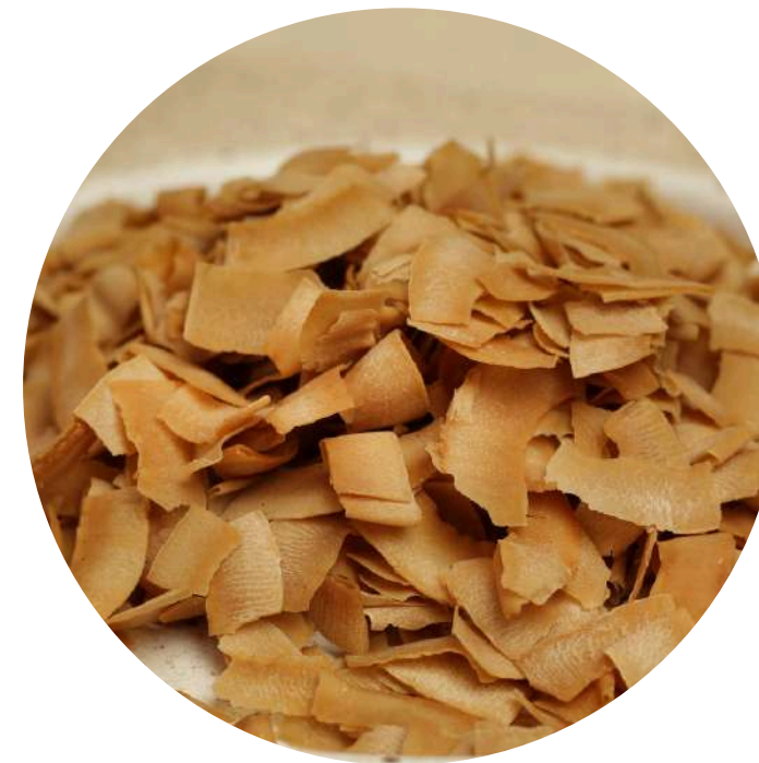
Coconut Chips 14,000/100gr