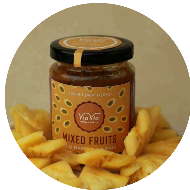
Mix Fruit Jam 65,000/jar Selai yang terbuat dari campuran buah nanas dan markisa dengan sedikit gula dan tanpa pengawet