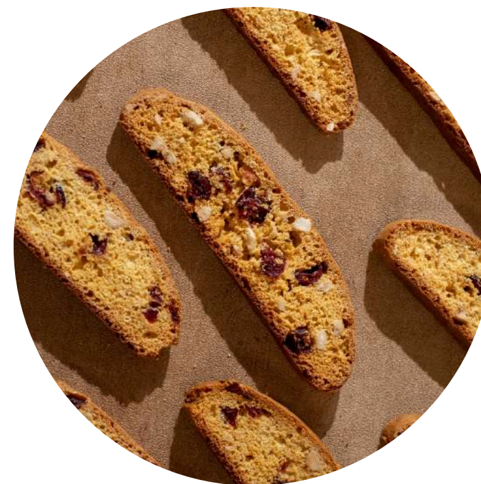
Almond Berry Biscotti 15,000/pcs